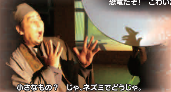
小さなもの？ じゃ、ネズミでどうじゃ。