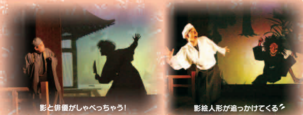
影と俳優がしゃべっちゃう！