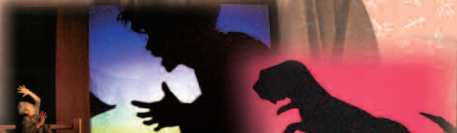
化けくらべ？ よし来い！ 手影絵で何でも化けて見せるわい！